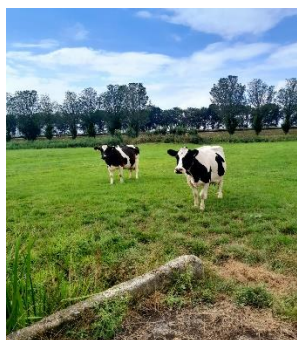
Melkbron 453 en 463